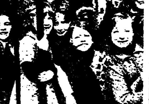
موظفو الخدمة يتناول الأطفال